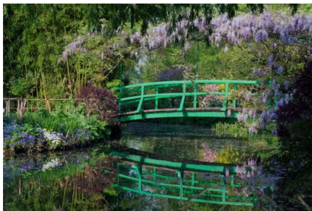
Vue du jardin d'eau Maison et Jardins Claude Monet. Giverny