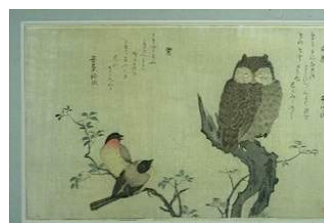
Kitagawa Utamaro, Hibou sur un tronc d'arbre et deux rouges-gorges