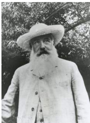
Claude Monet dans son jardin, photographié par Sacha Guitry vers 1913