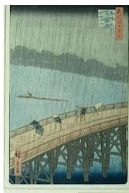
Utagawa Hiroshige, Ohashi, averse soudaine à Atake