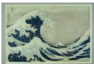
Katsushika Hokusai, Sous la vague au large de Kanagawa