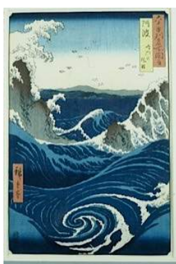
Utagawa Hiroshige, Vue des tourbillons de Naruto à Awa