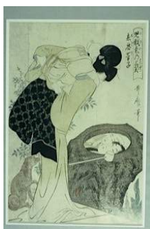
Kitagawa Utamaro, Eon Hoshi