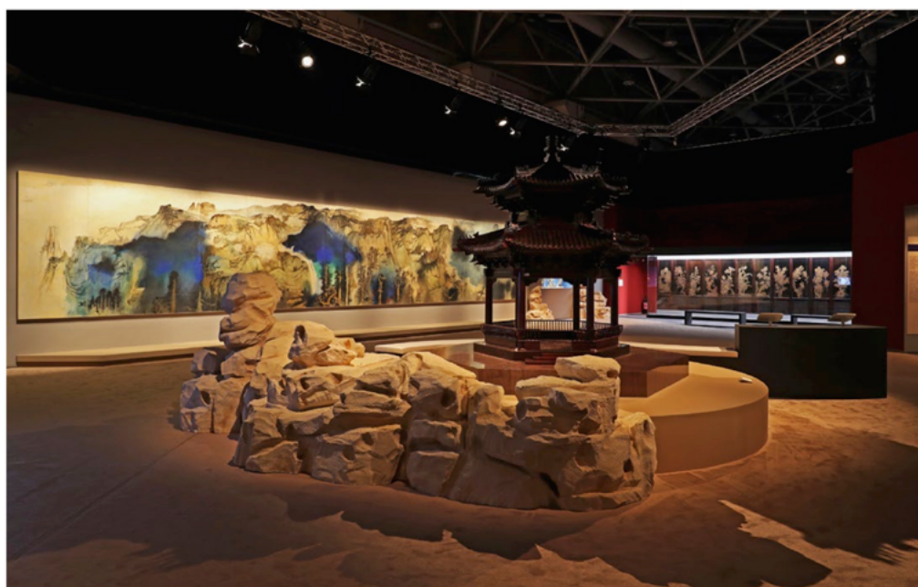
L'exposition « La Cité Interdite à Monaco ».