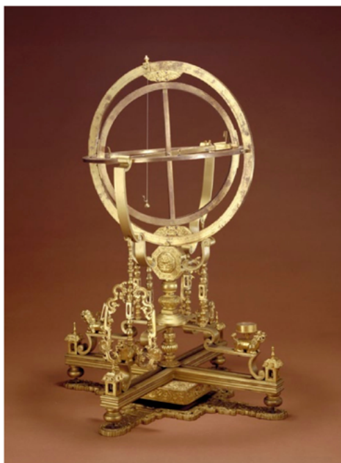
Instrument d'astronomie, dynastie Qing.