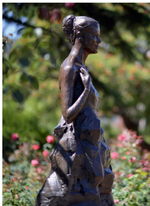
Roseaie Princesse Grace.

De nombreuses galeries organisent également des expositions remarquées. La Galerie de l'Entrepôt, 22 rue de Millau, est une adresse réputée où toutes les formes d'art trouvent leur place. Parmi les dernières galeries ayant pris leurs quartiers à Monaco, citons De Jonckheere au 27 de l'Avenue Princesse Grace, avec les grands maîtres hollandais qui ont fait sa réputation, mais aussi des œuvres plus récentes de Magritte par exemple ou des talents modernes. Signalons également la Galerie Moretti située au Park Palace, 27 Avenue de la Costa qui présente des œuvres de grands maîtres. On ne peut passer sous silence la Fondation Bacon inaugurée à Monaco en 2014 et dédiée à Francis Bacon.