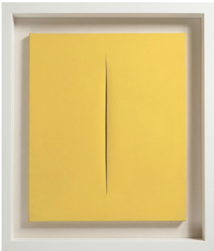
Lucio Fontana (1899 Rosario Sana Fé - Varese 1968), Concetto Spaziale, Attese , toile : 55 x 46 cm

Face à ces grands maîtres de l'art flamand, De Jonckheere expose une sélection de ses dernières plus belles acquisitions d'art moderne, où Lucio Fontana sera mis à l'honneur avec plusieurs exemples de Concetto Spaziale , et des pièces inédites d'un artiste incontournable du Surréalisme, René Magritte.