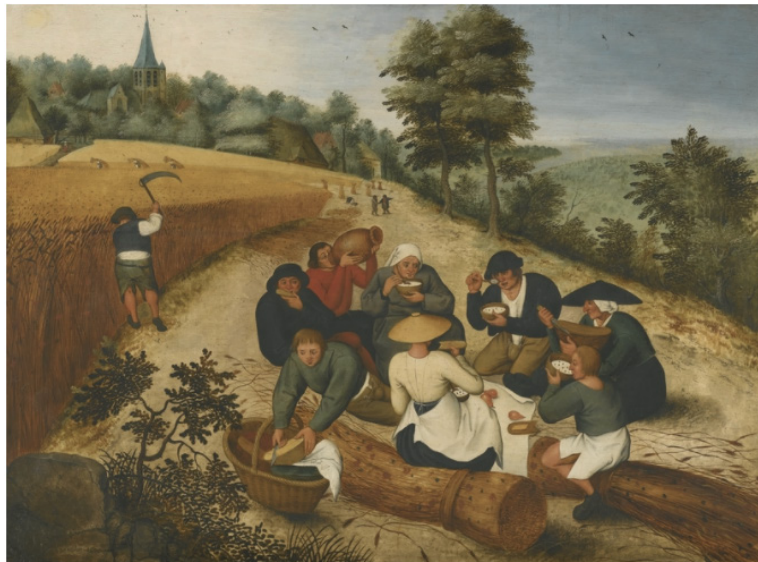
Pieter Brueghel Le Jeune (1564 Bruxelles - Anvers 1638), L'été : le repas des moissonneurs , panneau : 59,7 x 80,4 cm

Des scènes religieuses aux scènes rurales et célébrations traditionnelles, la diversité des sujets et des styles de la peinture flamande des XVIe et XVIIe siècles sont de parfaites illustrations de la vie dans les Pays-Bas méridionaux de l'époque. La richesse des détails et du vocabulaire pictural des tableaux exposés sont révélateurs de la modernité de cette peinture.