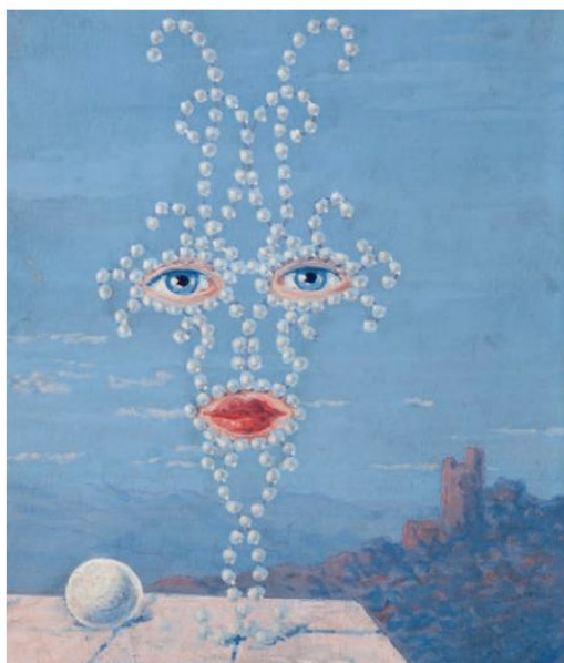
René Magritte (Lessines 1898 – 1967 Bruxelles), Shéhérazade , 16,7 x 12,7 cm