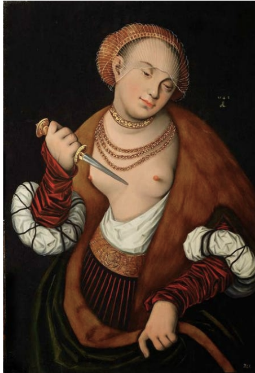
Lucas Cranach Le Jeune (1515 Wittenberg - Weimar 1586), Lucrèce, panneau : 77,3 x 53 cm

L'exposition inaugurale intitulée « Rencontre de Maîtres » réunit des œuvres majeures de maîtres anciens et modernes. Les compositions des suiveurs et émules du peintre Jérôme Bosch, parmi lesquels la dynastie Brueghel, Lucas Cranach Le Jeune, Abel Grimmer, Jan Van Kessel, Herri Met de Bles, Frans Snyders, Peeter Snyers, Isaak Soreau, Adriaen Van Stalbempt, David Teniers, Louis de Caullery, Francesco Guardi et Corneille de Lyon côtoieront les chefs-d'œuvres des maîtres modernes tels que René Magritte, Alexander Calder, Lucio Fontana, Jean Dubuffet, Nicolas De Staël ou encore Enrico Castellani.